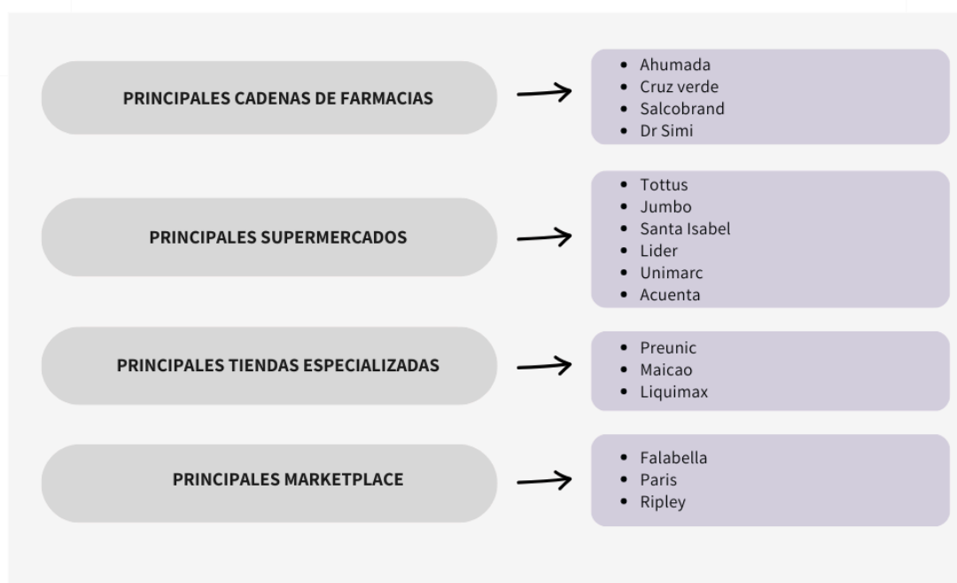
FIGURA N°2: TIPOS DE COMERCIOS Y PROVEEDORES.

A continuación, se detalla el tipo de comercio y los proveedores considerados en cada uno de los casos 8 .