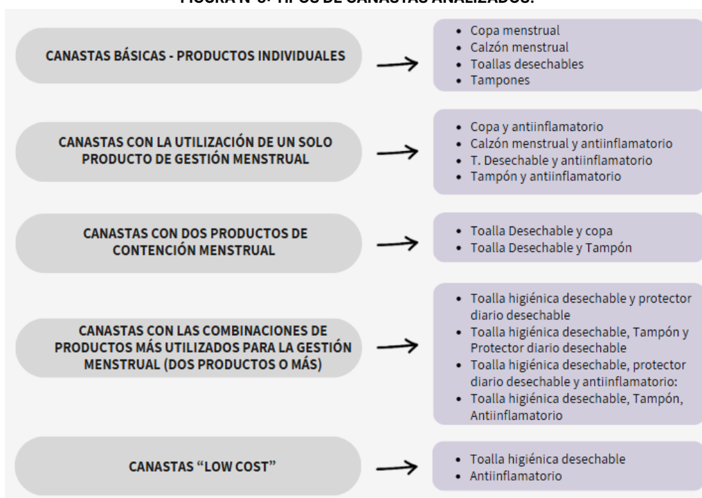
FIGURA N°5: TIPOS DE CANASTAS ANALIZADOS.

A continuación, se describen las canastas de productos presentes en este estudio: